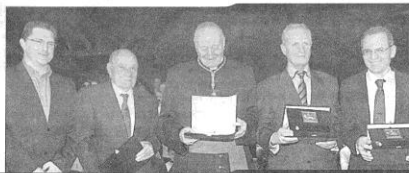
I Premiati con il «San Martino d'Oro»