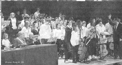
Il Coro «Stecchino d'Oro»